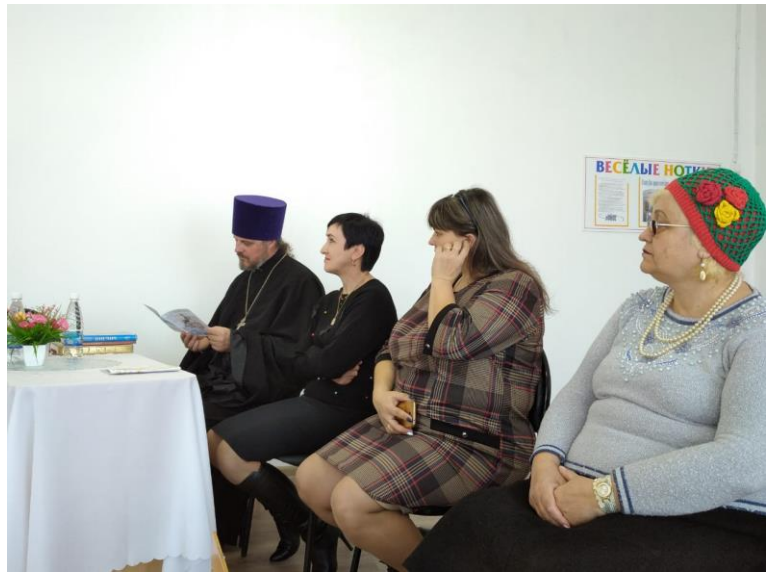
Настоятель Храма дарит книгу «Библия для детей» детскому саду.